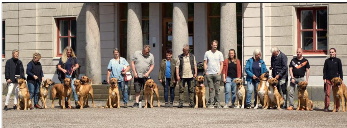
Broholmerträff i Vingåker